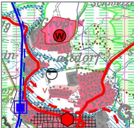
Karte 2: Ausschnitt Regionalplan

In der Strukturkarte des Regionalplanes Heilbronn-Franken 2020 des Regionalverbandes Heilbronn-Franken, gültig seit dem 03.07.2006, liegt der Teilort Ottendorf an der Entwicklungsachse Gaildorf – Schwäbisch Hall. Die Stadt Gaildorf ist im Landesentwicklungsplan als Unterzentrum mit Perspektive für ein zukünftiges Mittelzentrum ausgewiesen. Dadurch ergibt sich für die Stadt eine Bevorzugung bei der Entwicklung von Siedlungsschwerpunkten. Ein regionaler Wohnungsbau-schwerpunkt stellt das nordwestlich liegende Baugebiet Wörlebach dar. Das Plangebiet selbst ist im Regionalplan als Außenbereich ausgewiesen. Weiter liegt der Bereich in der regionalen Freiraumstruktur im Übergangsbereich eines Regionalen Grünzugs (VRG) sowie eines Vorbehaltsgebiets für Erholung (VBG) und ist als Landschaftsschutzgebiet ausgewiesen. Sonstige regionalplanerische Ziele werden von der Planung nicht berührt. Siehe dazu Karte 2.